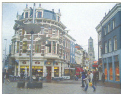
Land van de Markt

Vanaf het Centraal station is het ongeveer 10 minuten lopen. Hieronder volgt één van de routes. Volg de borden (looproute) naar het centrum, volg dan richting Willemsplein/Gele Ridders plein. U gaat voor het pand van de ABN AMRO bank rechtsaf de Bovenbeekstraat in.